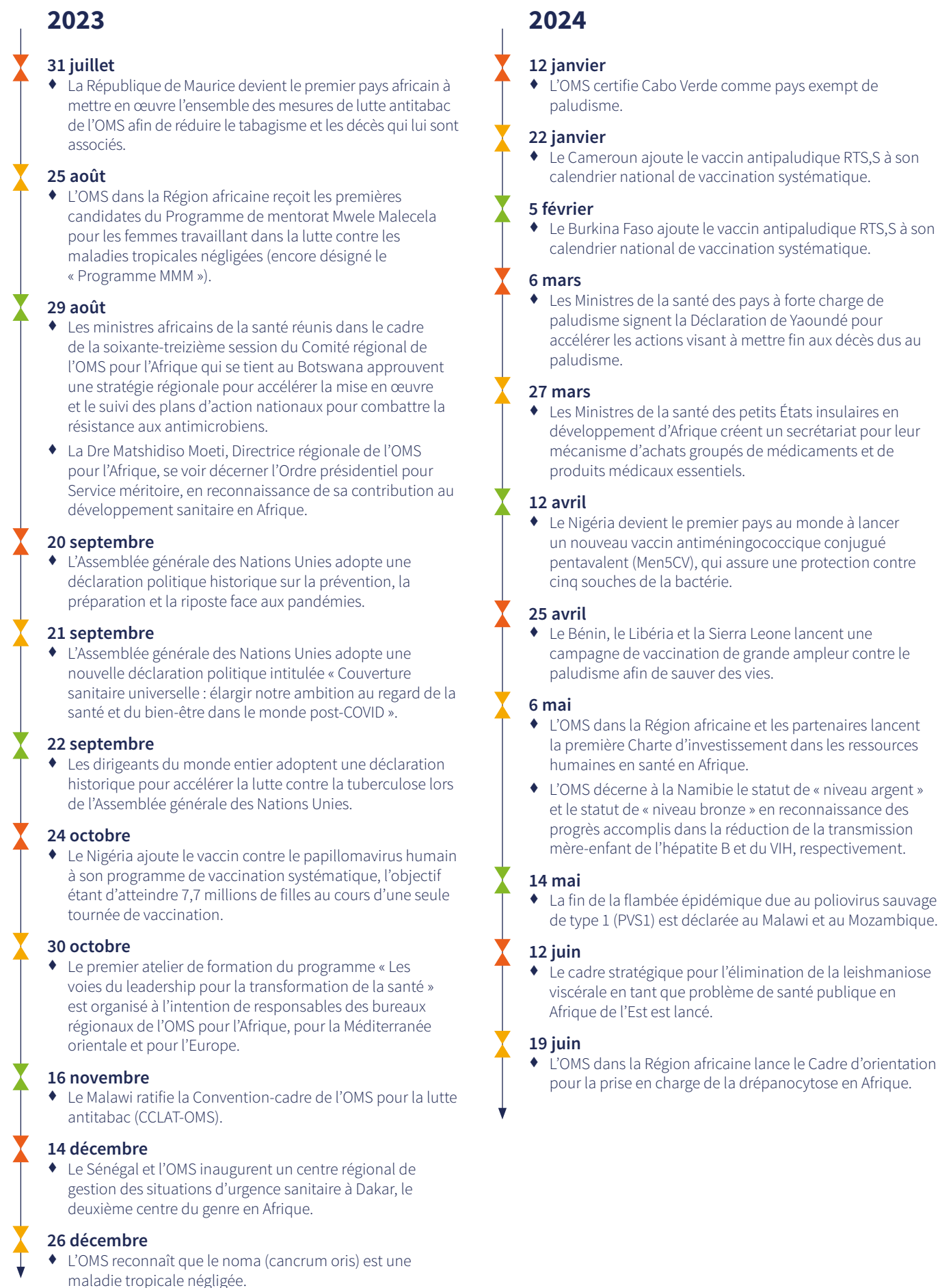
Fig. 1. Chronologie des événements clés