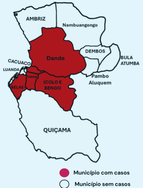
Mapa 1: Casos notificados por província e município.